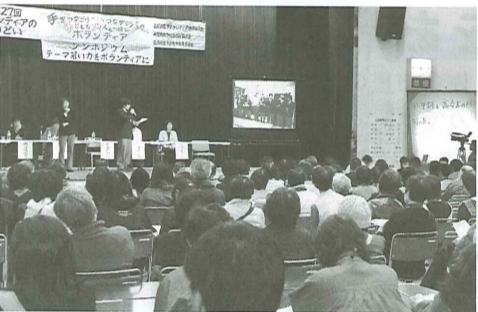
今年のボランティアのつどいは大盛況でした