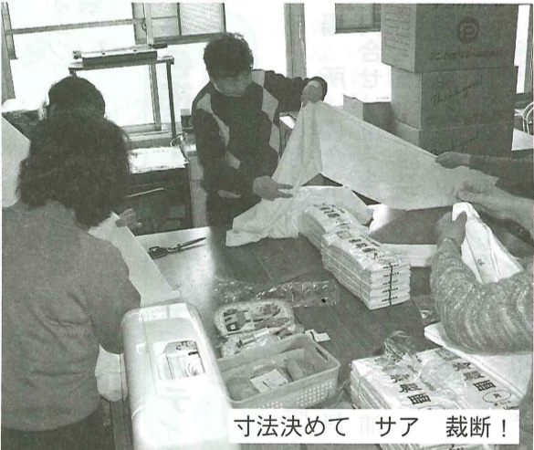
寸法決めて サア 裁断！

各自治会・町内会・区のみなさまには、社協会費、共同募金等をお願いする機会が多くあります。その際に「納金袋が必要」との声が年々大きくなっています。そこで現在、V連の好意で納金袋1000枚を5月完成を目標に作成しています。製作に携わっているのは登録ボランティア、資金源はV連の収集活動にあるのです。V連では、福祉活動に役に立てようと、長年「収集活動」に取り組み、市民の協力で集まった使用済みの切手やロータスクーポンなどを換金、又は形を変えて市内の施設等に順番で贈呈してきました。今回は、佐倉市内全体に還元できる