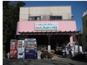
⑤キッズハウスれんげ

<住所> 佐倉市宮小路町 4-16 コミュニティカフェ れんげ&ラッキーハウス <電話番号> t/f 043-484-5807 <開催日時> 第1、第3土曜日 11:00~15:00 ※10月~オープン <参加費> 大人 300円・高校生まで 100円