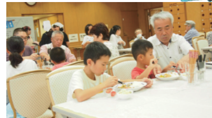
⑦せんなり村 ふれあい食堂