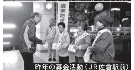
昨年の募金活動(JR佐倉駅前)

募金はすべて佐倉市内で生活にお困りの方への支援金などに使われます。今年も皆さまの温かいご支援をよろしくお願いいたします。