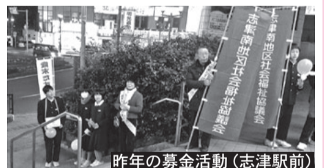
昨年の募金活動(志津駅前)

12月1日から歳末たすけあい運動が始まります。新たな年を迎える時期に皆さまのご協力を得て、地域でのたすけあいを展開する運動です。