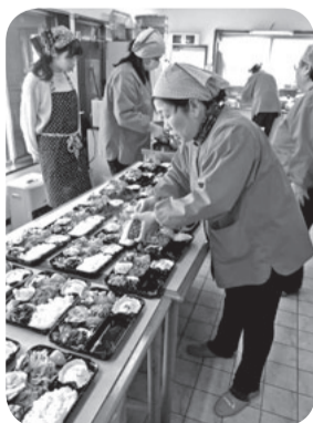
在宅福祉(とまとの会)

「じぶんの町を良くするしくみ」をキヤッチフレーズに、今年で70周年を迎える「赤い羽根共同募金」が、10月1日から全国で始まりま 街頭で、学校で、地域で、皆さまからお預かりした募金は、身近な地域での地区社会福祉協議会活動やボランティア、福祉団体の活動支援、災害支援などに使われています。 赤い羽根共同募金は、テレビや新聞のニュースに取り上げられないような地域の小さな活動に使われます。あなたの優しさが、あなたの行動が、きっとあなたの住む町を変える原動力になるはずで す。地域の中で小さな一歩を支える運動に、今年も皆さまのご理解とご協力をよろしく願っています。