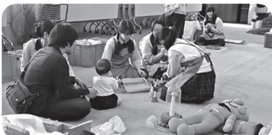
ボランティアセンター(おもちゃ図書館)

共同募金配分金が活かされています 皆さまからいただいた共同募金の配分金はボランティア活動を含む身近な地域の様々な福祉活動を支えています。