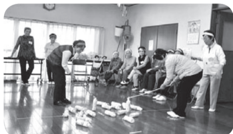
ボランティアセンター(いきいきサロン)