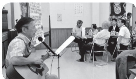
地区社協活動(佐倉東部地区社協)

共同募金配分金が活かされています 皆さまからいただいた共同募金の配分金はボランティア活動を含む身近な地域の様々な福祉活動を支えています。