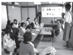
ママのほっとタイム (和田地区社協)