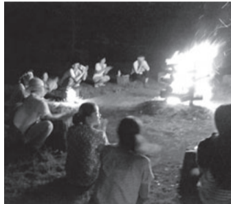
奨学生夏季交流研修キャンプファイヤー