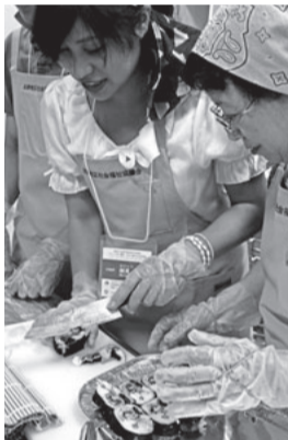
奨学生手作りの太巻き寿司作り