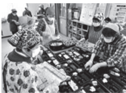
一人暮らし高齢者への配食サービス